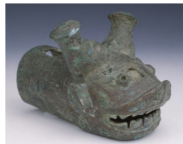
左：西周軛頭飾 右：商代軛頭飾

所以，要開車，就要先認車子的廠牌，要認車子的廠牌就先從 logo 認起，因為 logo 都裝在車子的最前端、最醒目的地方，讓你不想看到也難。否則開了一輛西爾貝（Shelby Supercars），別人還以為是裕隆汽車，那車主會多麼心痛啊！