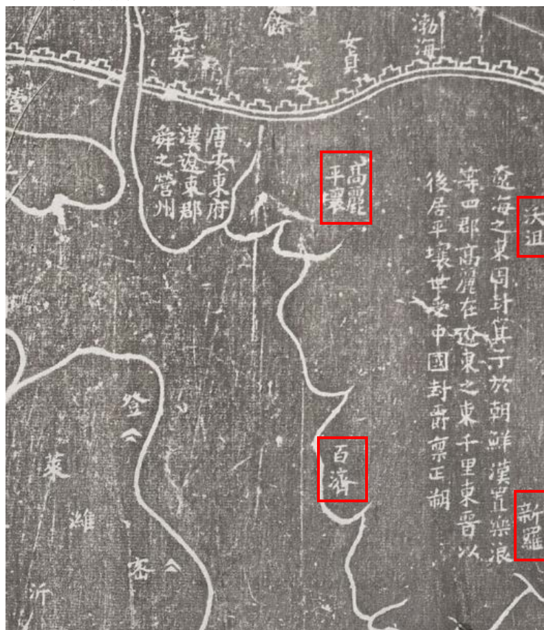
圖一：朝鮮半島解說文字

這幾個不同時期的國家與中國的關係為何？「遼海之東，周封箕子於朝鮮，漢置樂浪等四郡，高麗在遼東之東千里，東晉以後居壤，世受中國封爵，稟正朔。」述明朝鮮半島三國時代（427-660）各國的統治疆域，及其與中國的淵源。（圖一）這樣將不同時代的統治者並列在一張地圖當中，或許是一種另類的政治地理學知識的資料庫。