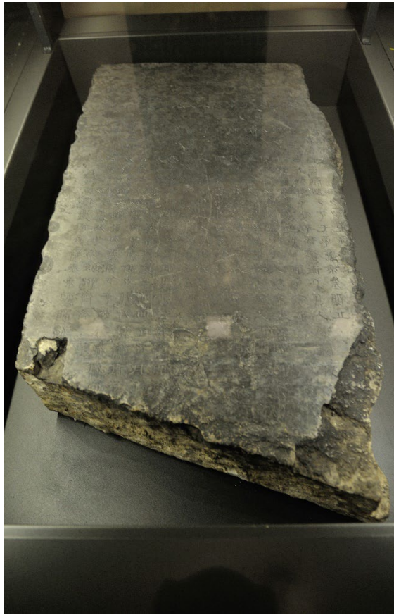
左：河南洛陽博物館藏