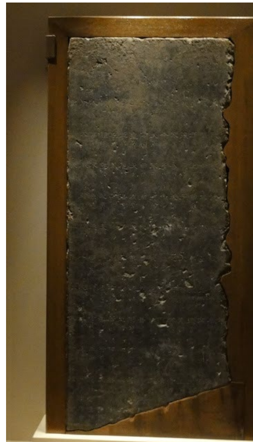
右：北京國家博物館藏