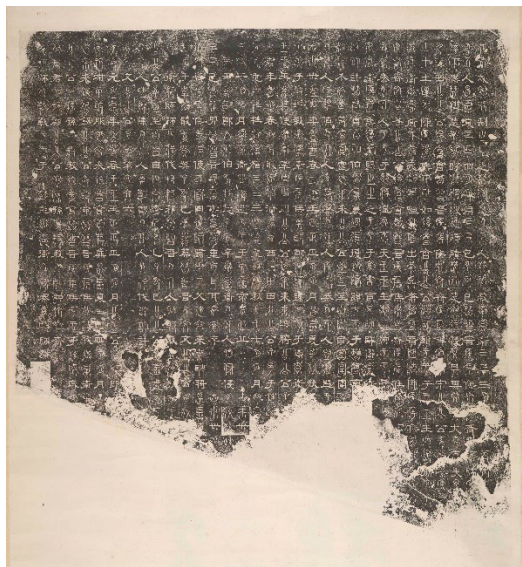
左：《春秋》初拓未剖本

《魏三體石經》又稱為《正始石經》、《魏石經》，三國曹魏正始二年（241）刻製，內容為十三經中的《尚書》、《春秋》和部分《左傳》。因為每字皆刻古文、篆書、隸書三種字體，故稱為三體石經。與漢代的《熹平石經》、唐朝的《開成石經》，並稱為中國古代的三大石經，都是官訂的教科書。